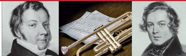
Johann N. Hummel