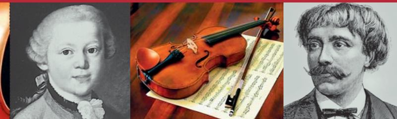
Wolfgang A. Mozart

Musikalische Gestaltung: Musiker des 33. Mai Festivals