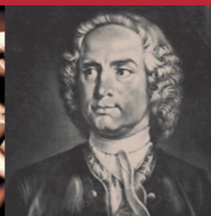
Pietro Antonio Locatelli