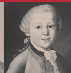
Wolfgang A. Mozart