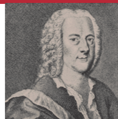
Georg Philipp Telemann